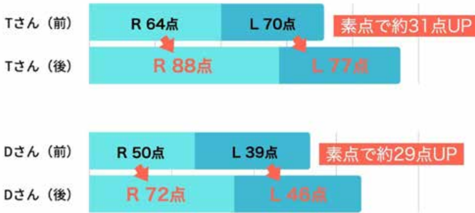
6日間のTOEIC集中合宿スコア推移 (12月22日開催)